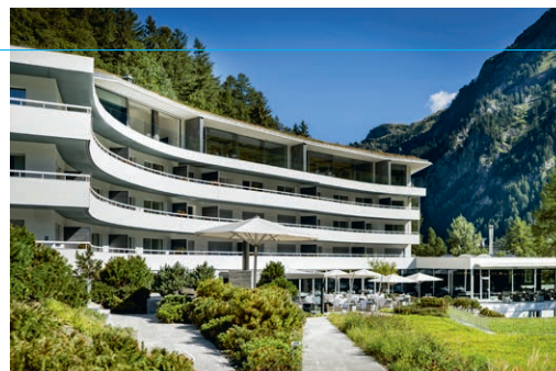
7132 Hotel, Vals