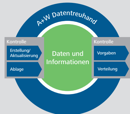
Treuhänderisch gesteuerter Prozess des Daten- und Informationsmanagements

RHÄTISCHE BAHN AG ETH ZÜRICH F. HOFFMANN-LA ROCHE AG KANTON SCHWYZ DIE SCHWEIZERISCHE CAMPUS SURSEE POST AG SIEMENS AG CREDIT SUISSE AG